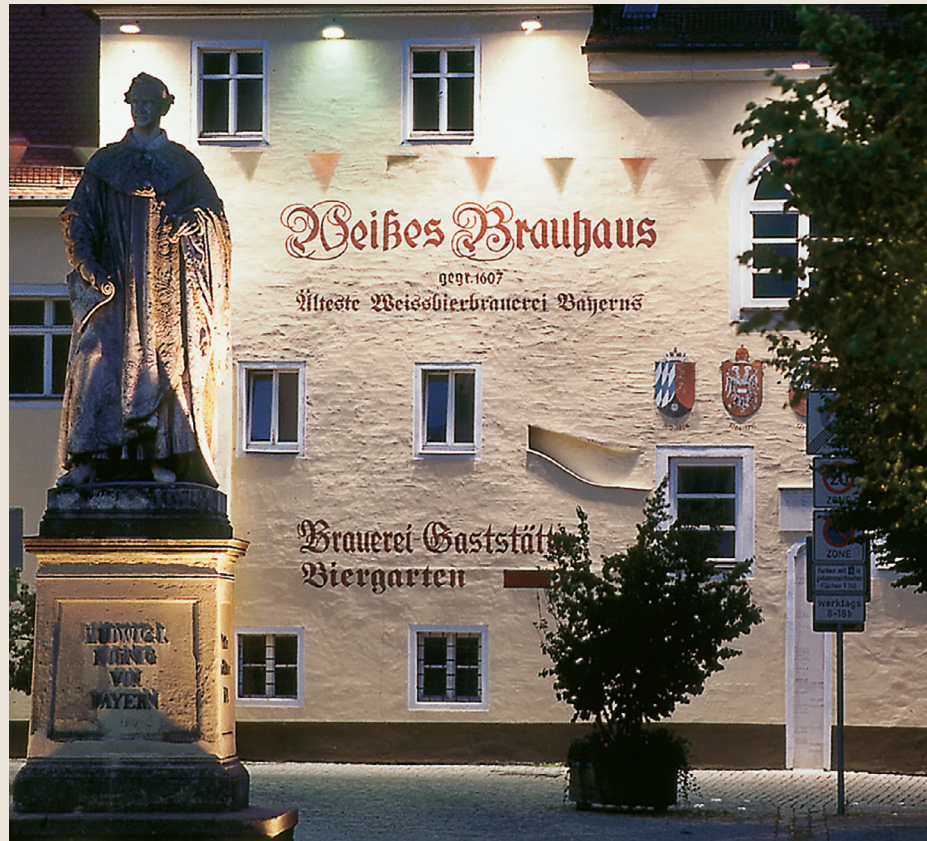
Weißes Brauhaus in Kehlheim mit König Ludwig Statue.

Ich danke Ihnen für das inspirierende Gespräch.