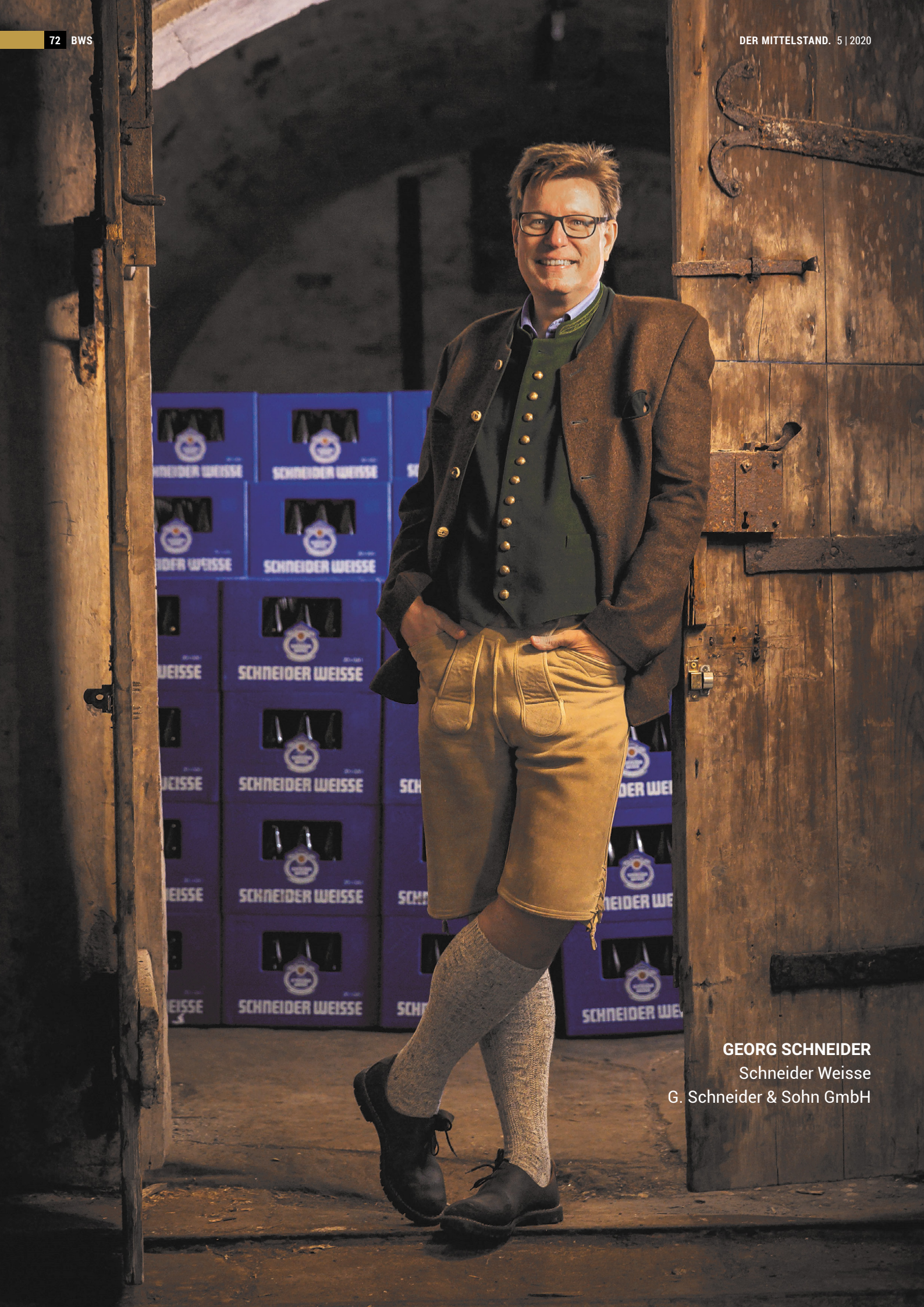
GEORG SCHNEIDER Schneider Weisse G. Schneider & Sohn GmbH