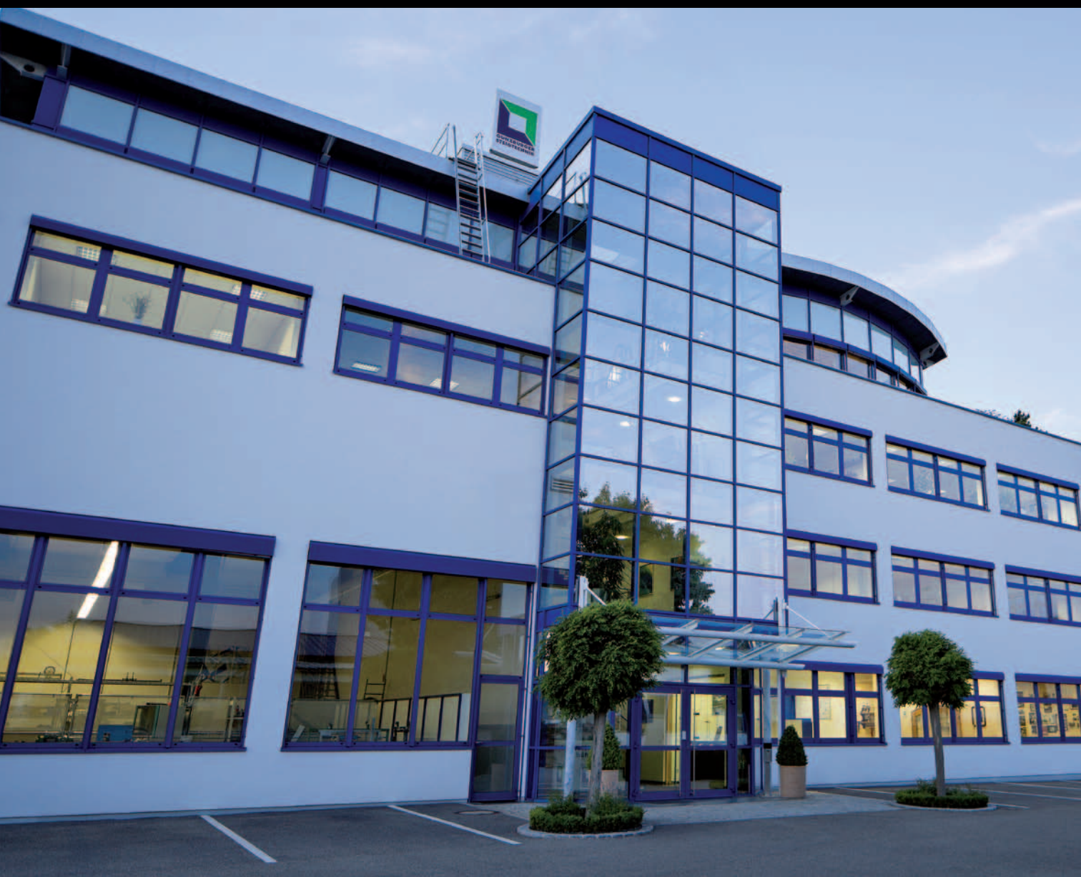
Verwaltungsgebäude der Günzburger Steigtechnik GmbH in Günzburg